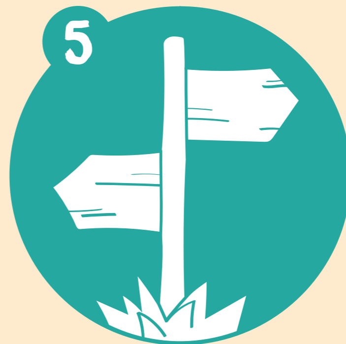
Señalización de las zonas identificadas.