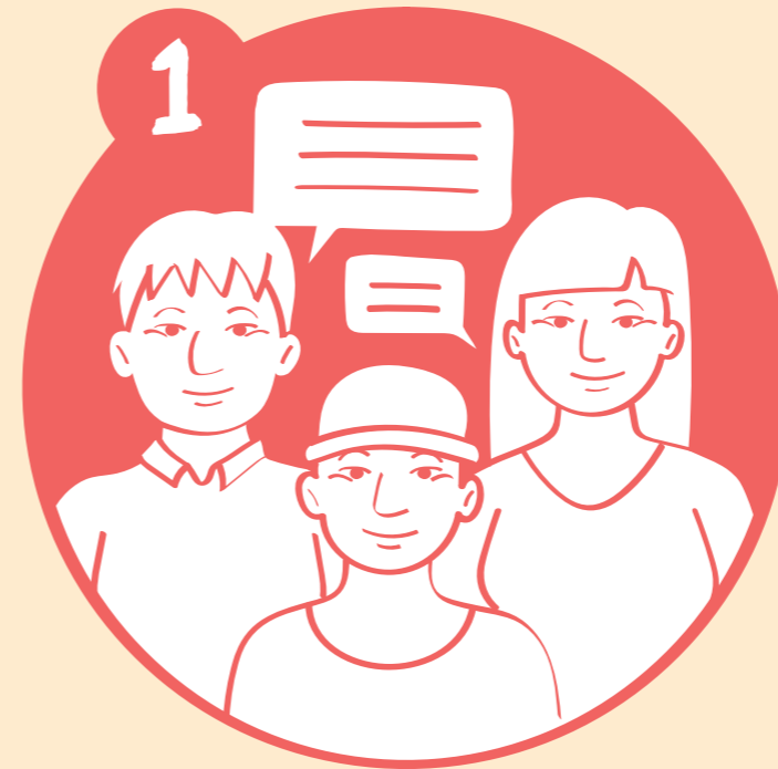
Elaboración del mapa parlante