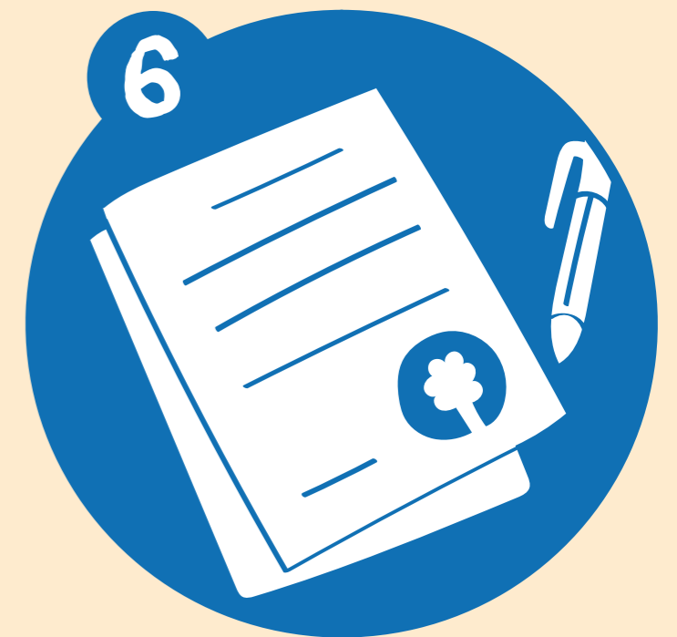
Establecimiento de reglas y acuerdos