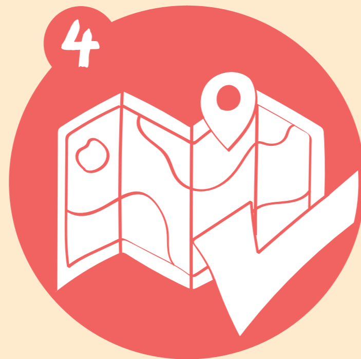
Validación y aprobación del mapa zonificado