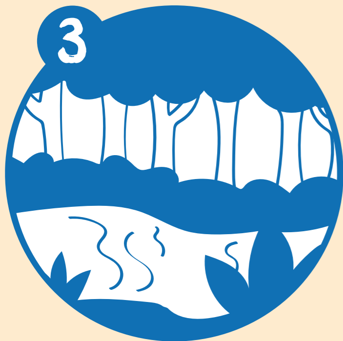
Verificación en campo