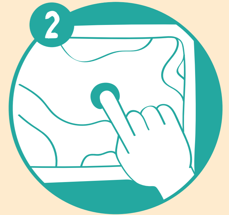
Digitalización del mapa parlante.